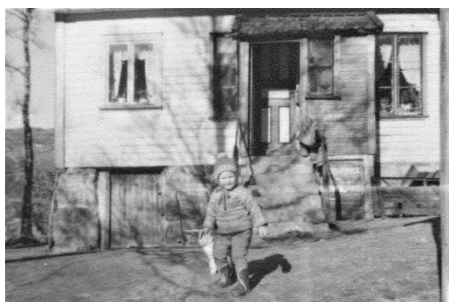
Auglend med et barn utenfor bislaget.