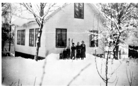
En snøvinter på Auglend.