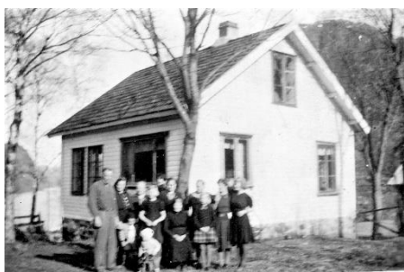
Familien samlet på Auglend.