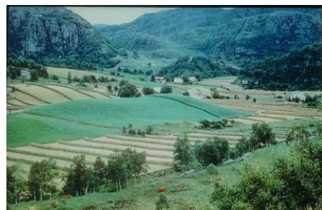
Utsikt en sommerdag mot garden Birkeland.